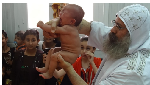
aan den volke getoond!