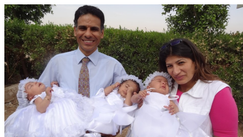
De trotse ouders met hun dochters!