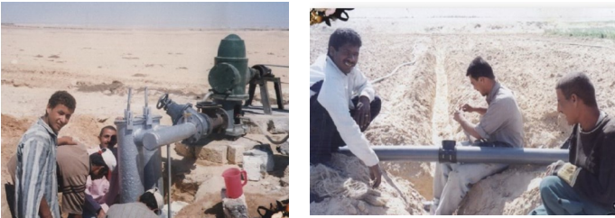
Installatie van de pomp en het leggen van een pijpleiding en een netwerk van slangen naar delen van de akker om het water te kunnen verdelen tussen de gewassen.

Woestijngebied is ontgonnen, een waterput geslagen, leidingen en waterslangen over het gebied aangelegd voor de irrigatie.