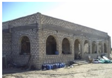
Een tehuis voor opvang van jongeren....

Op Green Desert Farm is men reeds begonnen met het bouwen van een tehuis voor de opvang van de groepen. Tevens wil men een trainingscentrum realiseren waar de werknemers de basisvaardigheden van lezen en schrijven aanleren.