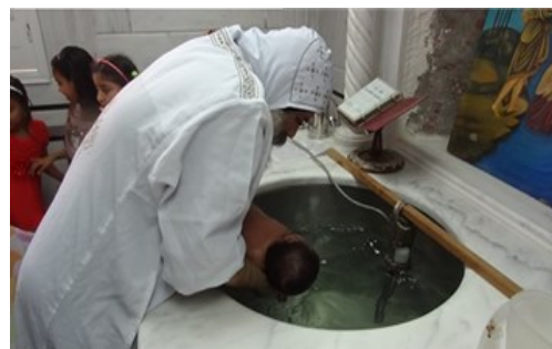
De kinderen worden ondergedompeld in het water en....