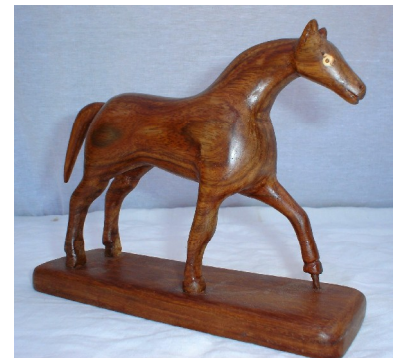
Een voorwerp gemaakt in de werkplaats en bedoeld voor de verkoop.

Ontzettend bedankt al degenen die ons aanmoedigen en steunen!