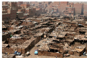
Vuilnis overal om je heen!

Lopende naar het gebouw waar aan de kinderen onderrecht wordt gegeven, rennen de ratten over mijn voeten; er is een vieze, doordringende geur van rottend vuil. Daar-